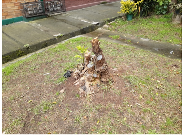
Foto N° 3. Individuo arbóreo de la especie sauco (Sambucus nigra) talado.