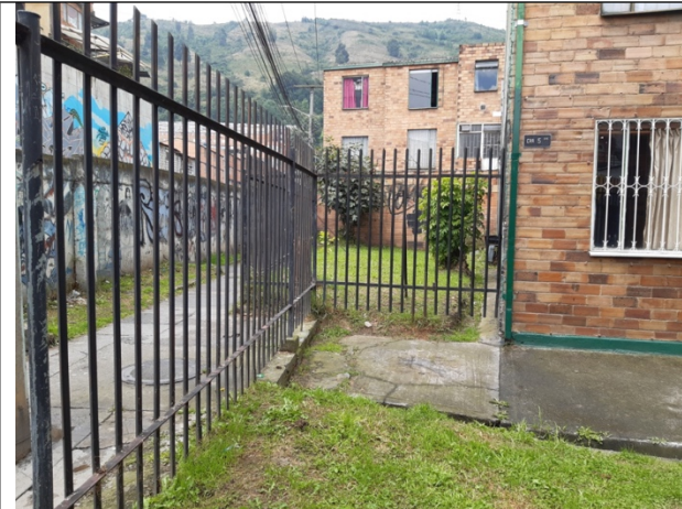
Foto N° 5. Zona verde con acceso restringido al público por cerramiento perimetral.