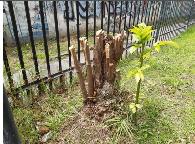
Foto N° 6. Tercer individuo arbóreo de la especie sauco (Sambucus nigra) talado.