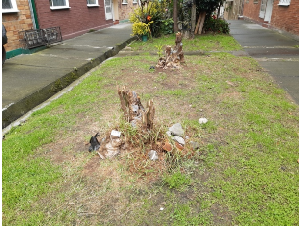
Foto N° 2. Individuos arbóreos de la especie Sauco (Sambucus nigra) talados.